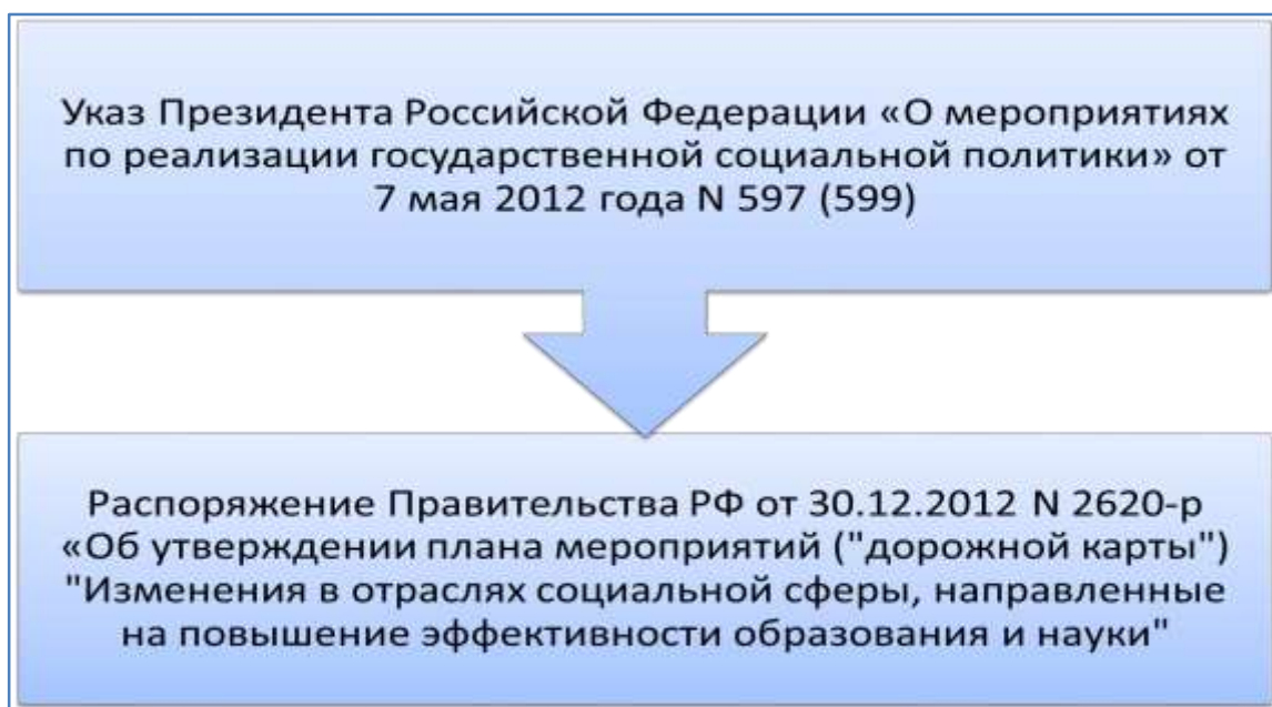
Рис. 1. Актуальные нормативные правовые акты в социальной сфере

Органы местного самоуправления, в соответствии с полномочиями, определенными нормативными документами, реализуют два основных полномочия, финансовое обеспечение которых идет в дополнение к региональному нормативу: